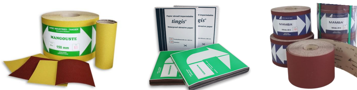
FIGURE 1 : PRODUITS ABRASIFS COMMERCIALISÉS PAR AFRIC INDUSTRIES S.A.