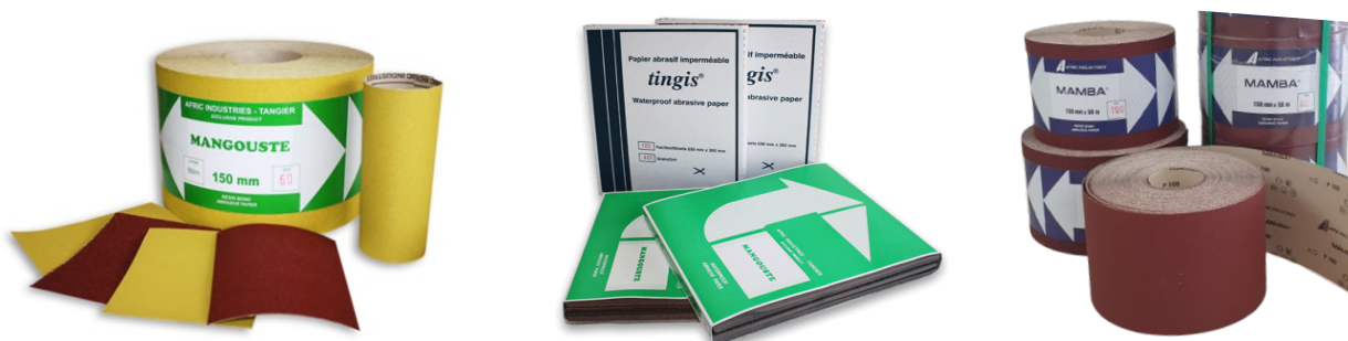
FIGURE 1 : PRODUITS ABRASIFS FABRIQUÉS ET COMMERCIALISÉS PAR AFRIC INDUSTRIES S.A.